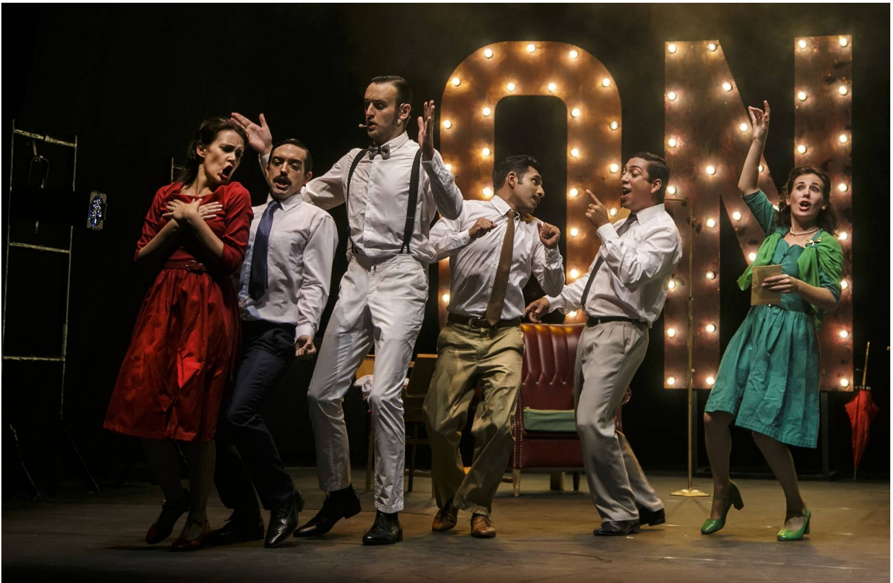
Los seis personajes de la obra 'Nora 1959', de la compañía The Cross Border Project, representada el miércoles en la feria de Ciudad Rodrigo.