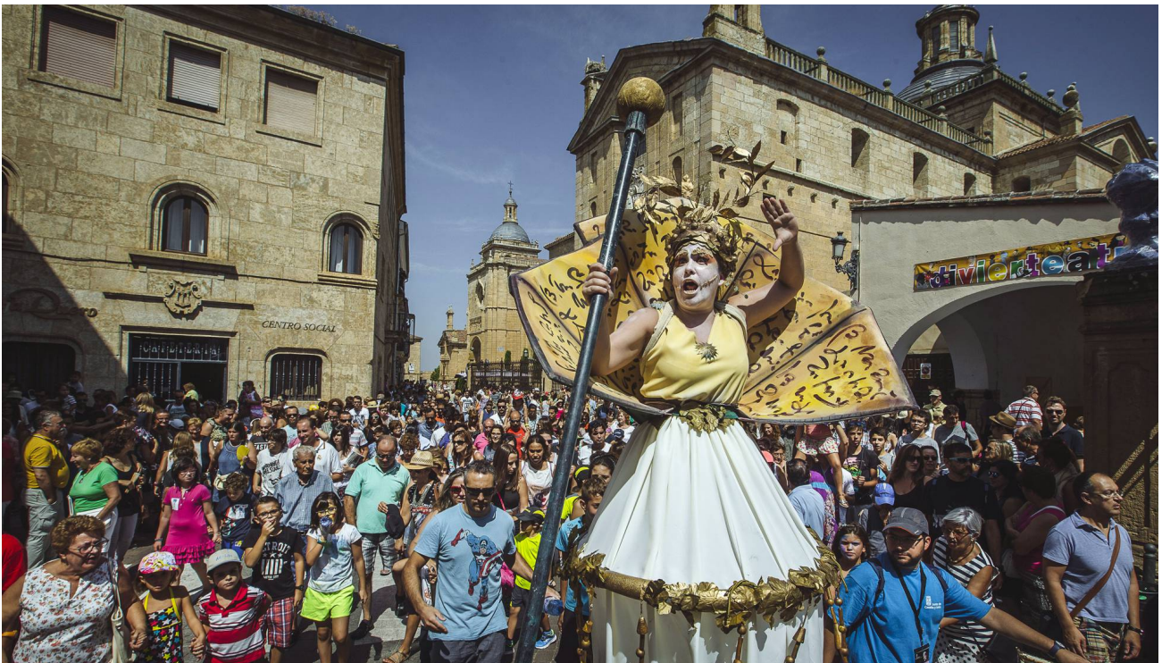
El espectáculo de calle itinerante '9 musas', de Karlik Danza Teatro, el jueves en Ciudad Rodrigo.

La Feria de Teatro de Castilla y León programa sus espectáculos en diferentes horarios para llegar a todo tipo de espectador